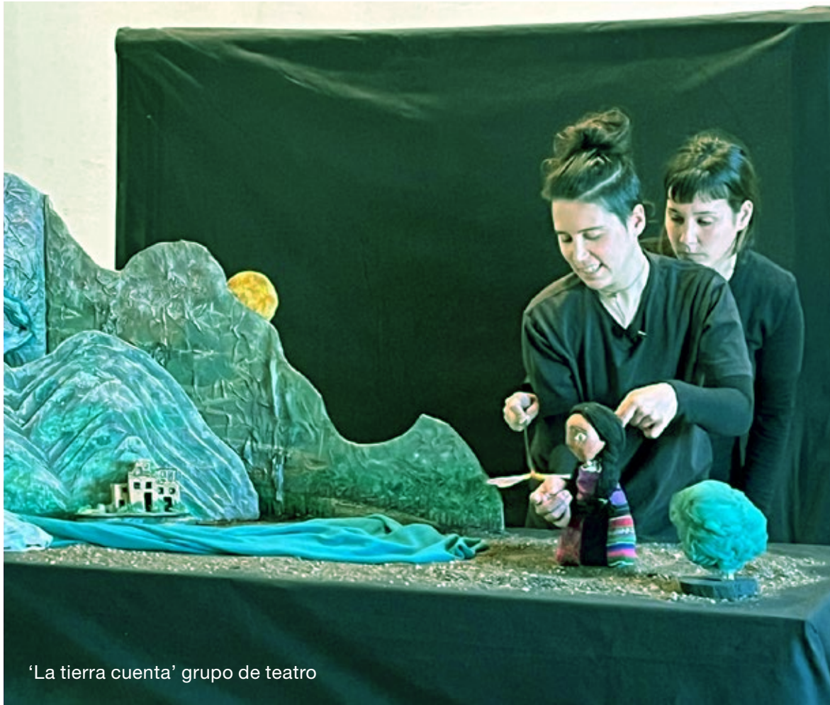
‘La tierra cuenta’ grupo de teatro

Las personas que se van a ver más afectadas por la crisis climática y sus impactos será la juventud de ahora y las generaciones futuras, por esta razón el rol de la juventud en la crisis climática es crucial para poder tener una transición ecológica justa y que mitigue los impactos del cambio climático teniendo en cuenta a todas las personas para poder tener literalmente un futuro posible.